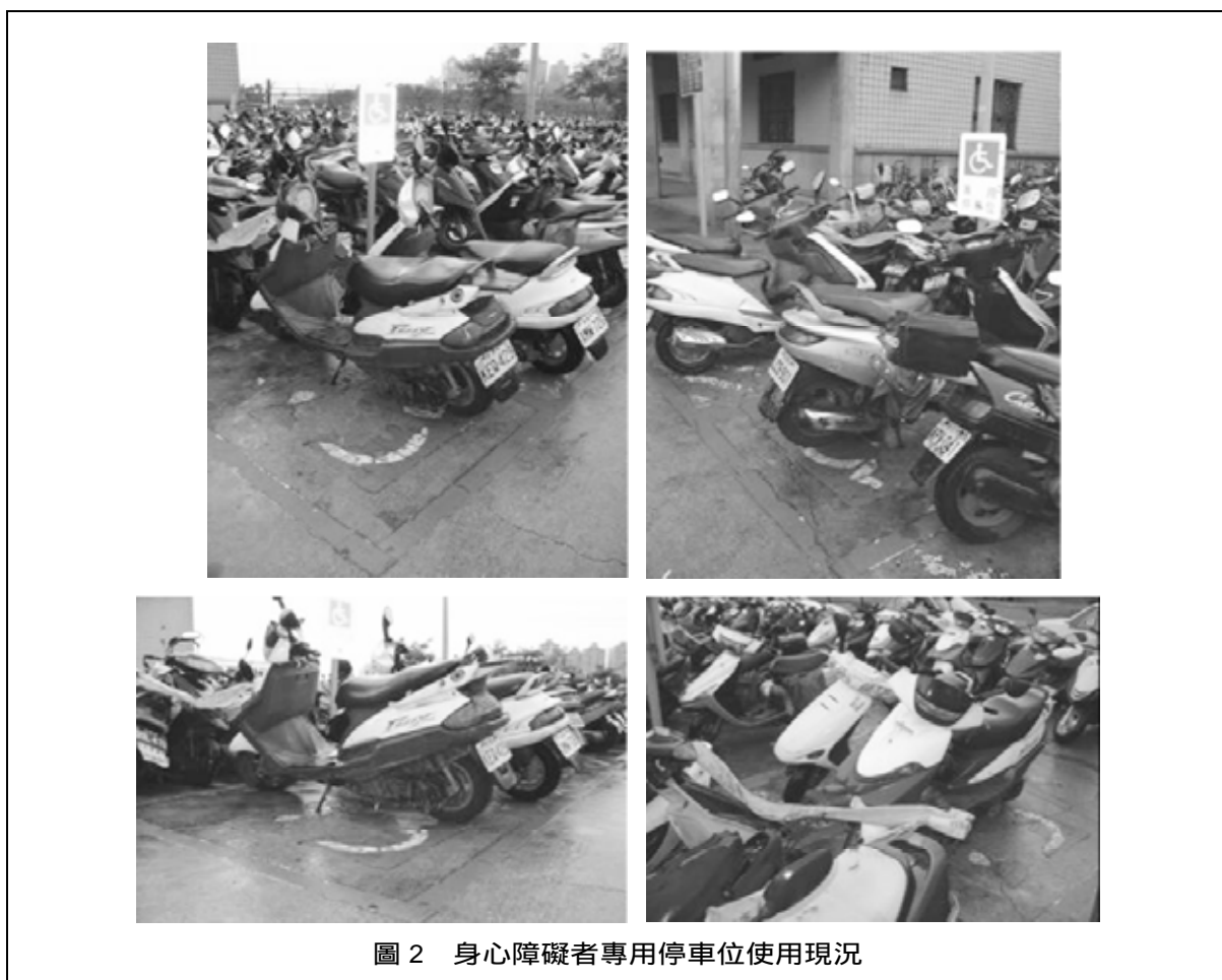
圖 2 身心障礙者專用停車位使用現況

可透過學生返家時與家人的分享，讓更多人對於所謂的「身心障礙者」的權利，有更正確的認識與尊重。此為筆者於照片攝影後的心得。