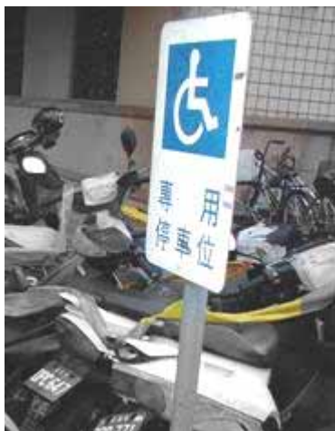
圖 1： 身心障礙者專用停車位標誌

本文旨在找出身心障礙者停車之相關的法條及罰則，並分享筆者於停車現場的觀察實例與心得。