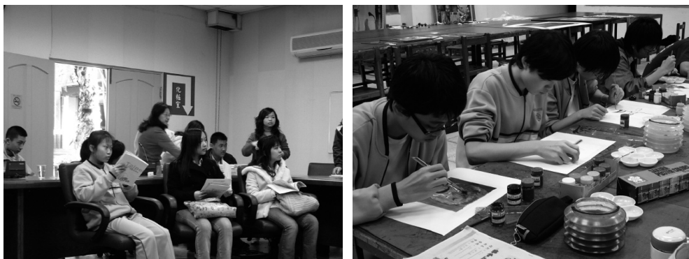
圖7 參觀高中職、生涯輔導、參加技藝教育學程

另根據教學觀察與輔導，找出學生的優勢能力與興趣，隨時與家長、學生討論升學資訊與生涯規劃，期望為學生找到合適的高中職；在高中職開學前，個管教師會主動與其輔導室聯絡，除傳承學生資料外，也分享輔導策略與經驗，以協助新階段的學校提早為迎接學生做準備，減少學生對新環境的不適應。