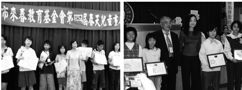
圖5 展現學生優勢能力

鼓勵有優勢能力及專長的身心障礙學生參加校內外各項比賽，舉凡繪畫、演講、朗讀、運動、生活科技競賽……等，都可以看到學生參與其中，並獲得優異的成績表現；身心障礙學生的優勢能力藉由比賽讓普通班的師生看到，無形中增加了同儕相處上的話題，也讓身障學生給人一種耳目一新的感受，大大地拉近與同儕相處的距離，也成為同學欽羨的對象。