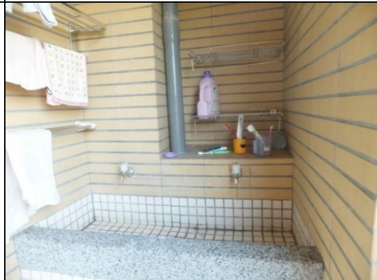
寢室設有洗衣台及曬衣空間