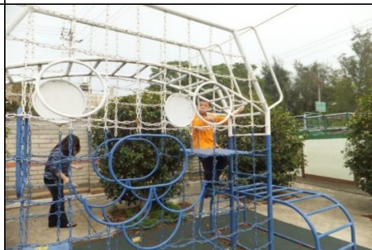
宿舍外有籃球場及遊樂設施

●需住宿者請連同報名表與住宿申請表一併傳真 04-25565639 至臺中市立啟明學校 謝秘書 收