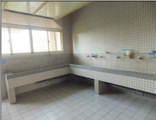
公共區設有洗衣空間和脫水機