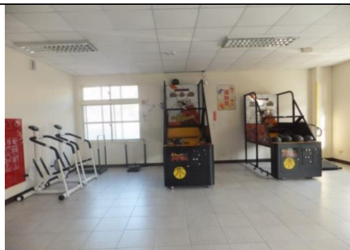
一樓設有籃球機、健身器材