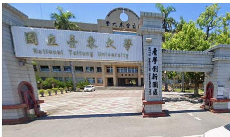
圖 3 臺東大學臺東校區大門口廣場實拍圖

(四)研習結束如欲轉乘公車至火車站可轉乘東台灣客運「8172」號公車前往火車站。相關資訊如連結：