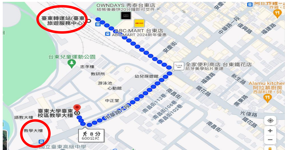
圖 1 臺東轉運站至研習會場步行距離與時間評估圖