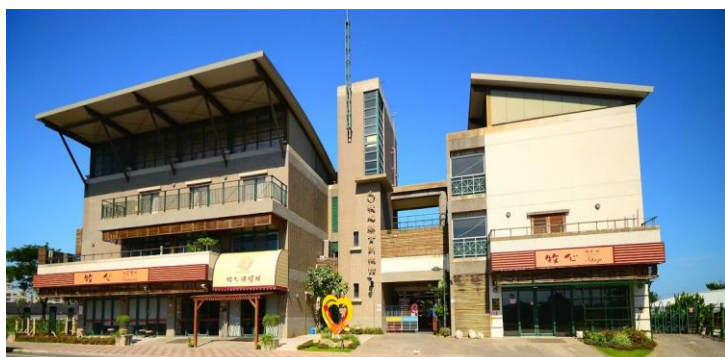
↑牧心智能發展中心